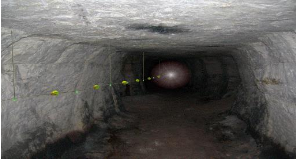
Şekil-1: Hayat hattı görünümü

18. (Ek:RG-10/3/2015-29291) (3) Yeraltı madenlerinde, hazırlık faaliyetlerinin yapıldığı alanlar ve üretim panoları gibi yeraltı maden işletmesinin bütün bölümlerini kapsayacak şekilde ve çalışanların yerüstüne çıkmalarını kolaylaştıran; yanmaya, kopmaya ve aşınmaya karşı dayanıklı bir hayat hattı kurulur (Şekil-1 ve Şekil-2). Bu hatlar acil durum planlarına uygun olarak yerleştirilir.